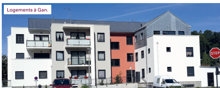
Logements à Gan.