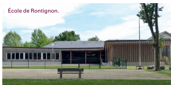
École de Rontignon.